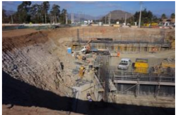
Imagen N°05. Trabajos Enlace La Cantera