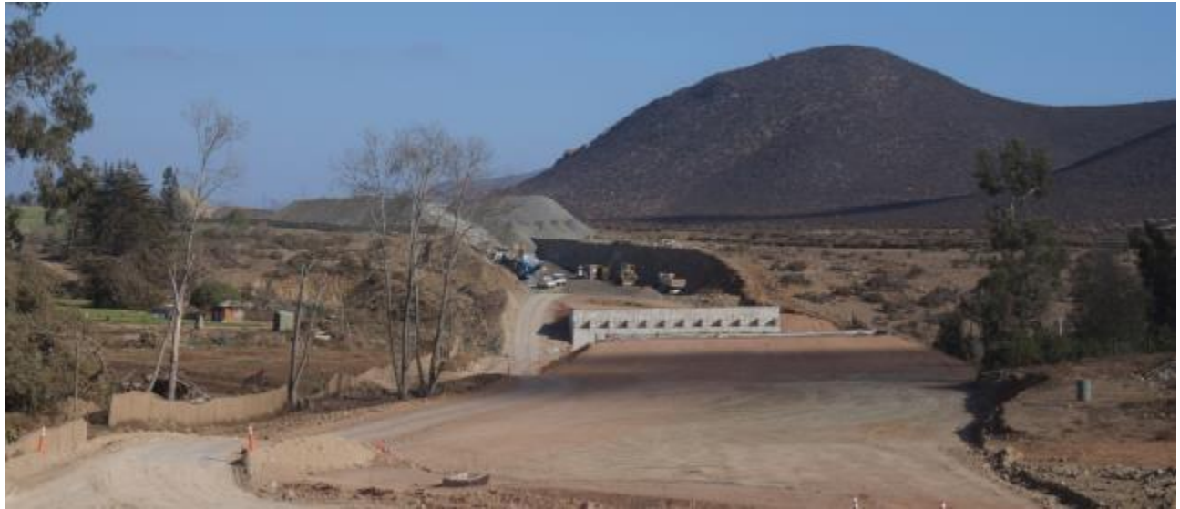
Imagen N°01. Trabajos Puente La Laguna