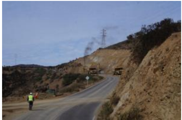
Imagen N°03 Trabajos de Corte Las Cardas