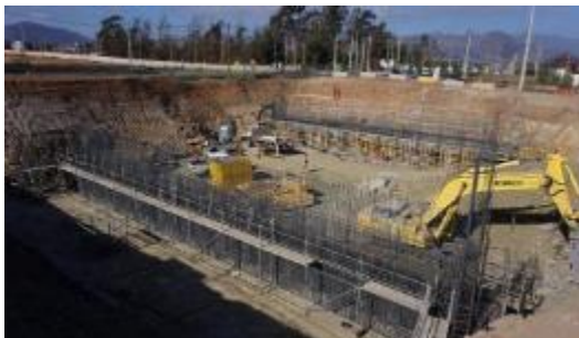
Enlace La Cantera

Tramo 4: Avenida Las Torres se ejecutará calzada simple entre Av. La Cantera y Av. Balmaceda.