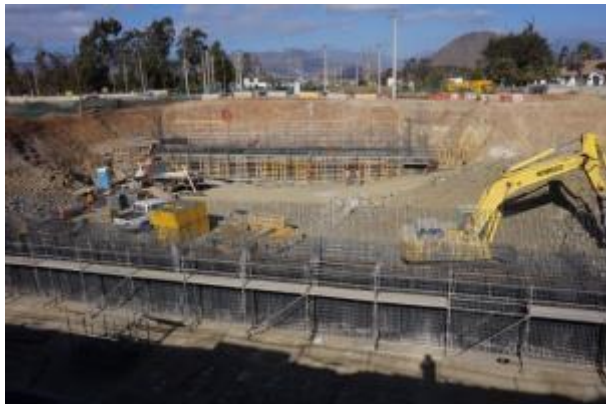
Imagen N°04. Trabajos Enlace La Cantera