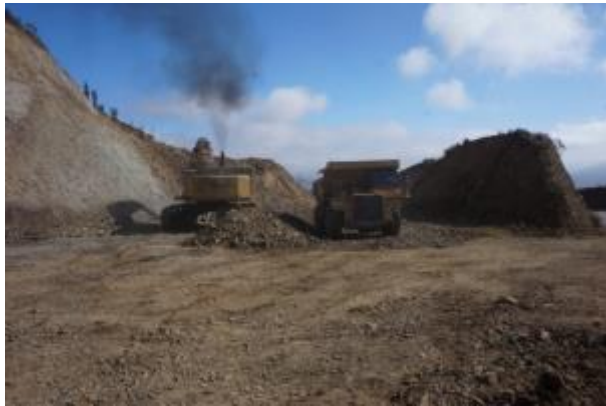
Imagen N°02 Trabajos de Corte Las Cardas